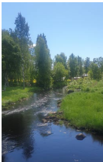
Rosån i sommarprakt